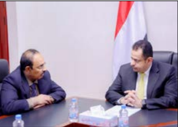
المتقدمين لدى اليمن، إلى أن الحكومة وحرصاً على إتاحة الفرصة للجهود وسفراء عدد من دول الاتحاد الأوروبي