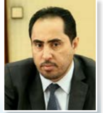
نايف البكري وزير الشباب والرياضة

رواية منسوجة من خيوط الاعتزاز الوطني الفاخر، حاكها ثوار بدمائهم الزاكية، رسمت طريق الجمهورية الكبرى، ووضعت أسس الدولة المدنية التي تسع الجميع. الـ 26 من سبتمبر، أمل متجدد لا يبيل بالتقدم، يوم بزوغ شمس حرية الشعب، حين خرج الوطن من عباءة سوداء معتمة، جثمت عليه دهرا، حجبته عن محيطه، لم تقدم له سوى التخلف والوهن والفقر. أودع على الدولة بأبواب صماء، لا يُسمع من وراءها، ولا تسمع من خلفها، ظاهرها كباطنها، محكمة بالرأي الأوحى، الوطن فيها هو سوط على ظهر خادم كادح يولد كأن لم يكن، فاقدا للقيمة، ليس إلا وقودا إن هلك استبدل بغيره. نأق الشعب الويل حتى ضاق به الذرع، فقرر بكل شجاعة واستبسال أن يكون إلى إحدى اثنتين، إما حياة كريمة وعيش بحرية تبني الدولة التي افتقدتها، أو