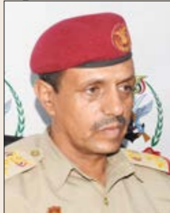
فقد كان فاعلاً ناصرًا لهم

ولفت إلى أن الشهيد اللواء ناصر الذيباني، أقسم بأن العدو الحوثي لن يندس أرض مأرب، وقد أبر بقسمه ذلك، واختتم نضاله بأن سقى هذه الأرض بدمه الطاهرة، مترحمًا عليه وعلى جميع الشهداء الأبرار.