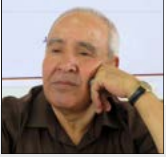
اللواء / محسن خروف *