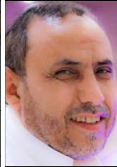
تغيير المناهج الدراسية يعمق من الفجوة الثقافية والفكرية في البلاد

وأفاد بأن النقابة وجهت نداءً دولياً لتوفير حماية قانونية أقوى مع تعاون مؤسسي أكبر في شكل شبكة تضامن بين المؤسسات في جميع أنحاء العالم، لردع من يستهدف تسييس المناهج والتعليم ومؤسساته في اليمن.. مضيفاً أنه تم إطلاق مبادرات مع مجموعة من المنظمات الدولية والوطنية