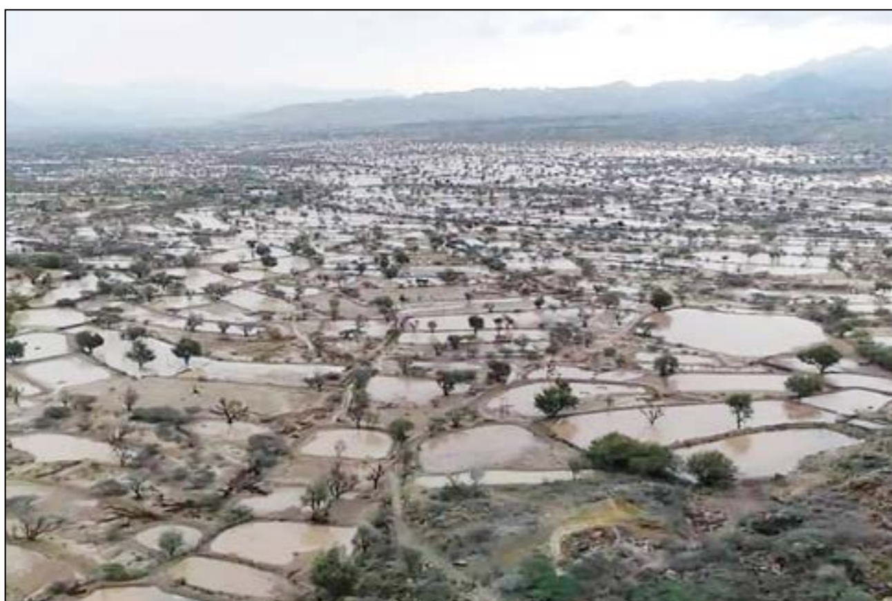
فرصة من ذهب

وتمن عالياً العزيمة والإصرار التي يتحلى بها الصحفيون في مواصلة العمل ونقل الحقيقة في ظروف غاية في الصعوبة والتعقيد وتشكل خطراً على حياتهم.. مشدداً على ضرورة تذييل