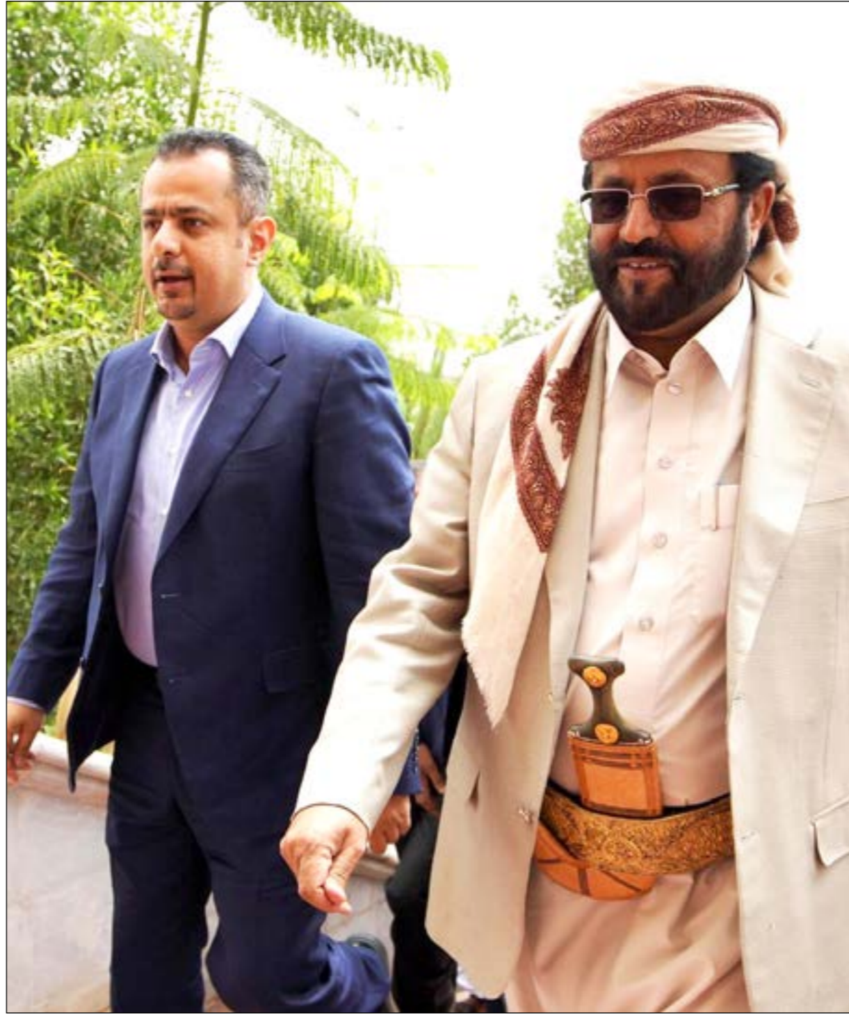
بات العالم يدرك يقينا أن مأرب حاضرة بقوة في القاموس السياسي والعسكري وفي قاموس السلام .. ولذا فإن مأرب أرضا وإنسانا ستسجل قريبا أيقونة النصر لحاضر اليمن ومستقبله.

والحق أن ما بعد الدعوة للتعبئة العامة لن يكون كما قبلها، وقد ظهرت مؤشرات التغيير في ساحة المعركة بصورة جلية ، وستنبئ الأيام القادمة كل من تهاون عن القيام الفاعلة في معركة اليمنيين الذين يصدرن أروع الأمثلة في التضحية والفداء بالنيابة عن الأمة العربية في مواجهة الغزاة الذين تحطم أحلامهم أمام فوهات بنادق الأبطال في جبهات مأرب وكل الجبهات.