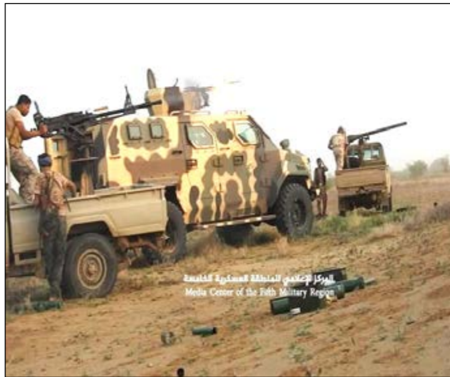
المرکز الإعلامي للمحافظة العسكرية الخامسة Media Center of the Fifth Military Region