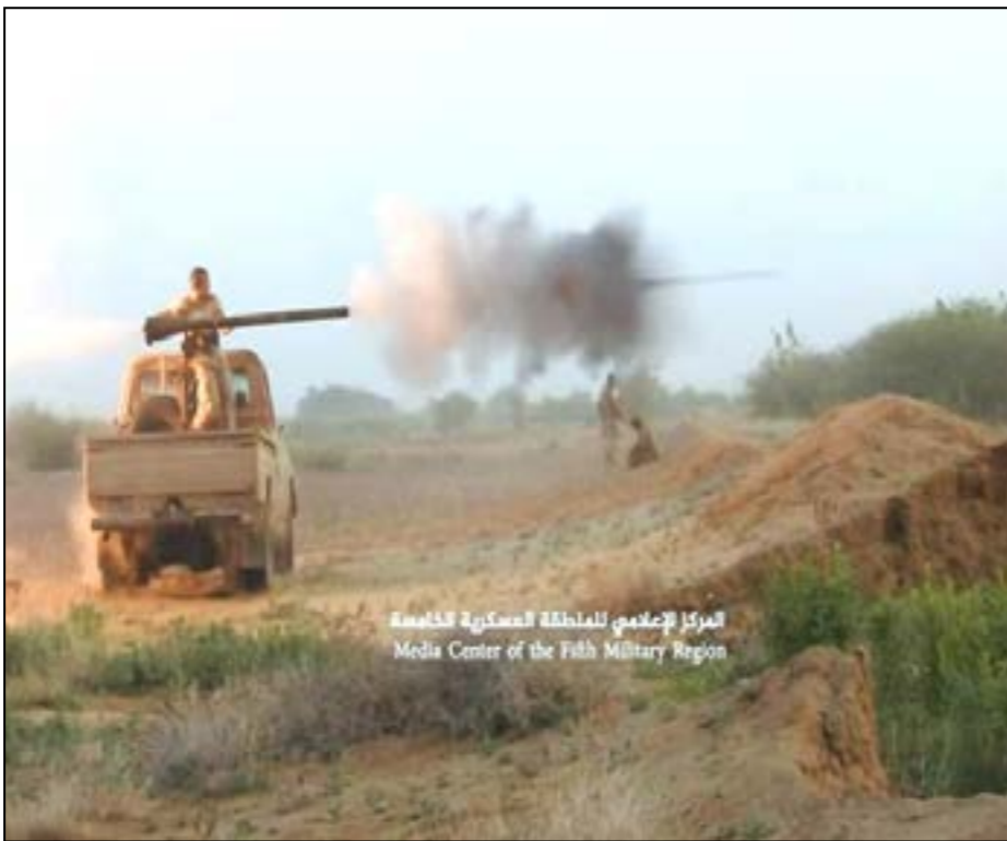
المرکز الإعلامي للمحافظة العسكرية الخامسة Media Center of the Fifth Military Region

وطالب البيان الأمم المتحدة ومنظماتها الإنسانية والحقوقية بالتدخل العاجل لتوفير الحماية للنازحين والمتضررين.