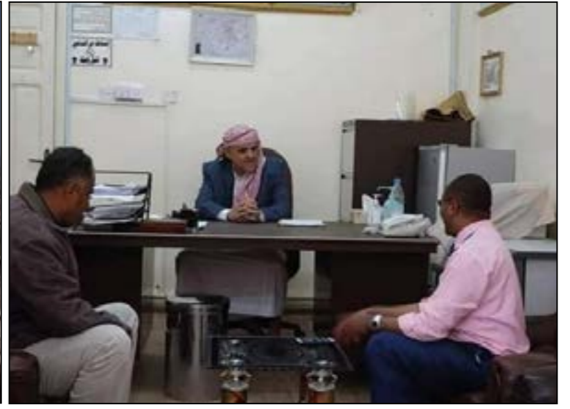
في زيارته لمركز العفا التدريبي بالشمايتين ومستشفى خليفة العام بالترتبة