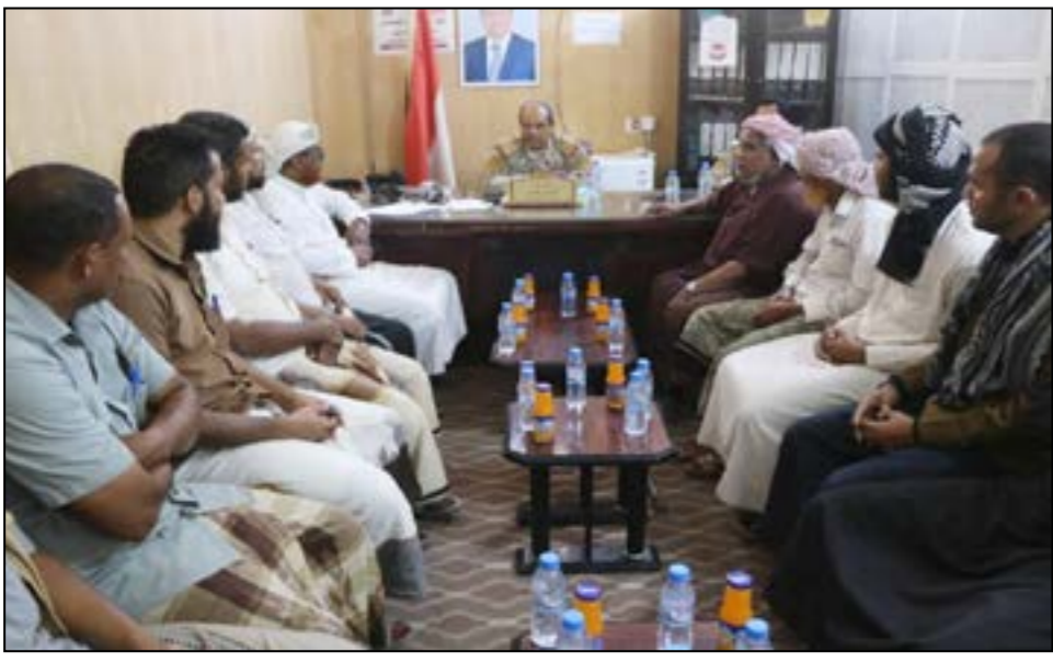
في لقائه وفدا دعويا من حضرموت