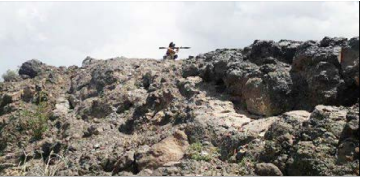
فؤاد مسعد - خاص

حققت قوات الجيش الوطني بمحافظة الضالع في الأيام القليلة الماضية سلسلة من الانتصارات العسكرية على المليشيا الانقلابية وأجرتها على الفراع والتراجع شمالاً باتجاه محافظة إب.