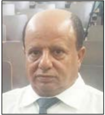
د. نبيل العربي

يمكن تحديد موقف الجرائم والاعتداءات، واستهداف المواقع المدنية التي يرتكبها الانقلابيون والحوثيون وبايعاز من فارس على اليمن والشقيقة المملكة العربية السعودية من الشرعية الدولية بالنظر إلى حجم القواعد الدولية والمواثيق والإعراف التي خرقتها هذه الجماعة والتي يمكن تحديدها في الآتي: